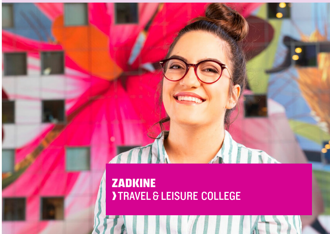
ZADKINE › TRAVEL & LEISURE COLLEGE