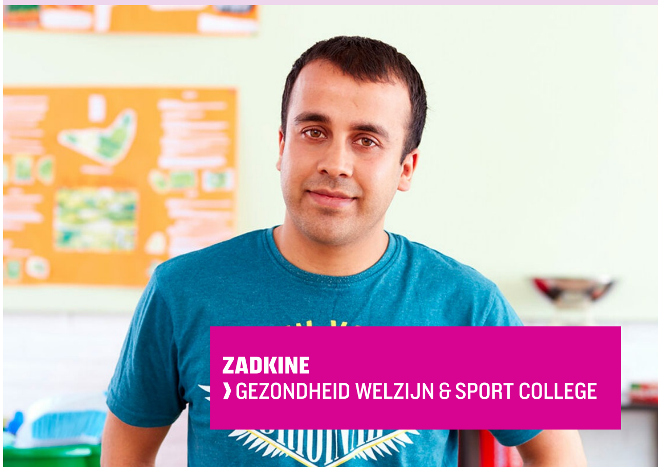
ZADKINE › GEZONDHEID WELZIJN & SPORT COLLEGE