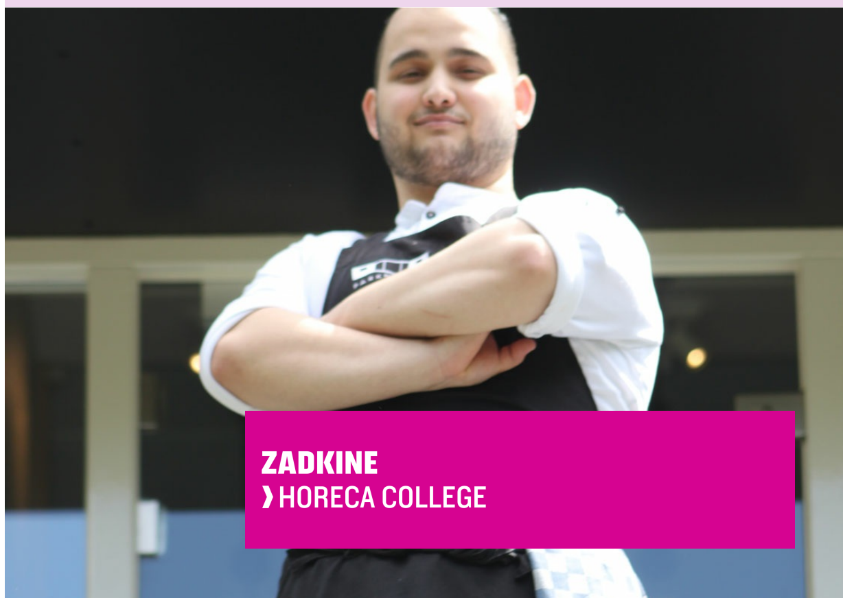
ZADKINE › HORECA COLLEGE